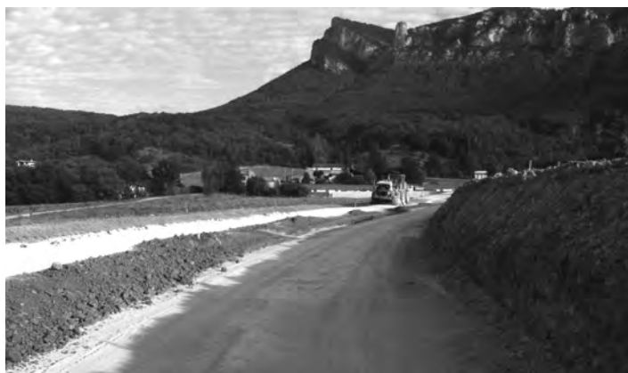
Traitement des remblais à la chaux

Le fond de forme est constitué d'une couche de terre de remblai malaxée avec de la chaux hydraulique sur une épaisseur de 0.70 m.