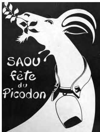
Affiche de la fête en 1977