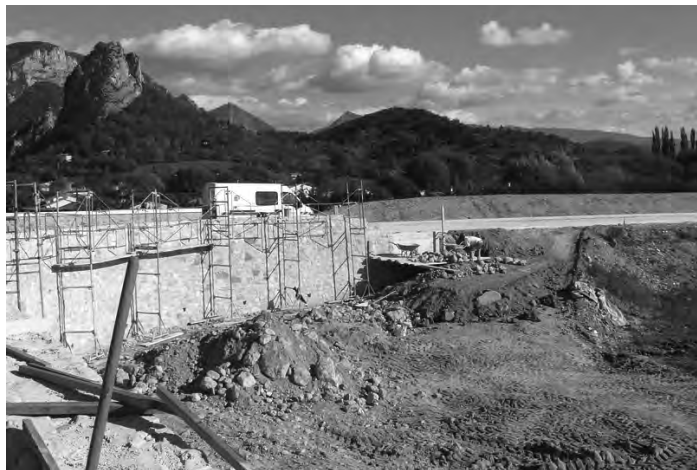
Beaucoup de poussière Mur du rond-point en cours de construction

Les remblais détrempés ne pouvaient pas être traités suivant les normes techniques ; un délai de séchage a dû être respecté.