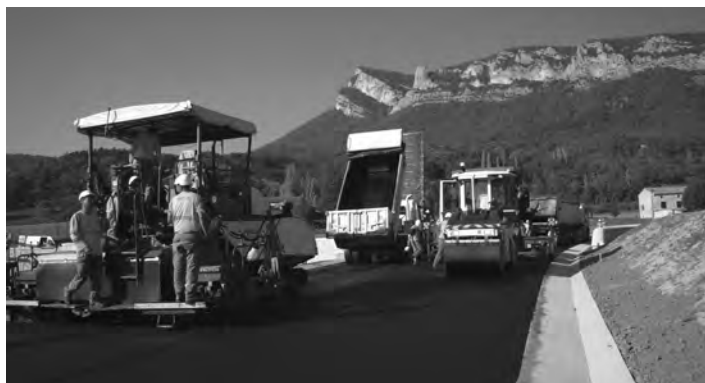
Le rond-point à l'entrée de Saoû, route de Crest Un soin attentif aux finitions

Cet ensemble supporte le revêtement de roulement constitué d'un enrobé bitumineux.