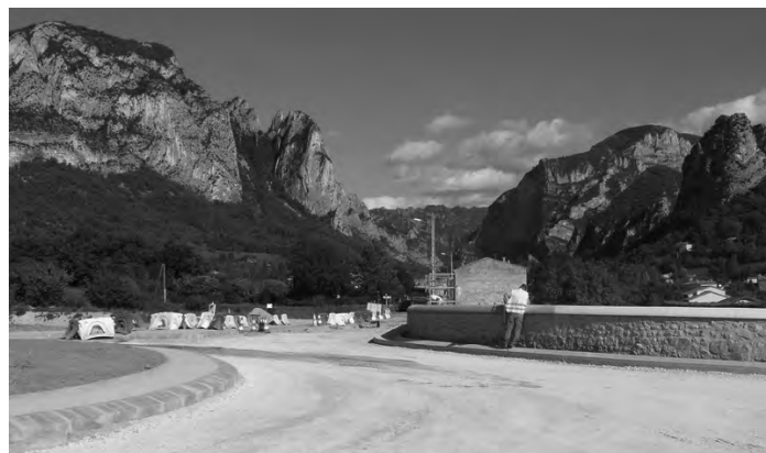
Le rond-point de l'entrée de Saoû

Période pendant laquelle les Saoûniens devront réfléchir à son aménagement décoratif.