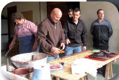
20 novembre Foire aux Fruits d'Hiver Un succès de fréquentation sans précédent. Bravo à tous les bénévoles !