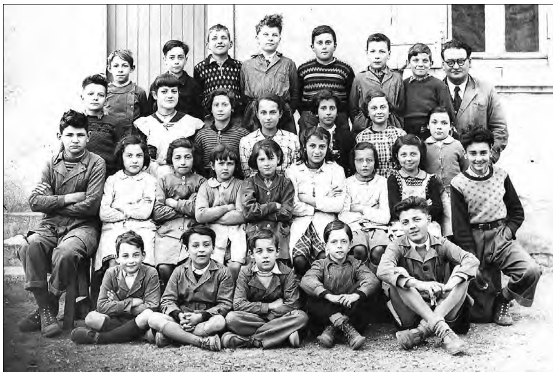
La classe autrefois... et aujourd'hui ! Petit jeu : retrouverez-vous "qui est qui" entre les deux époques ?