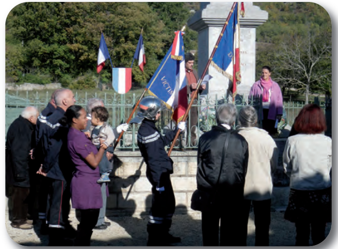
11 novembre Comémoration de l'Armistice En présence des pompiers, de villageois et de l'amicale des anciens combattants.